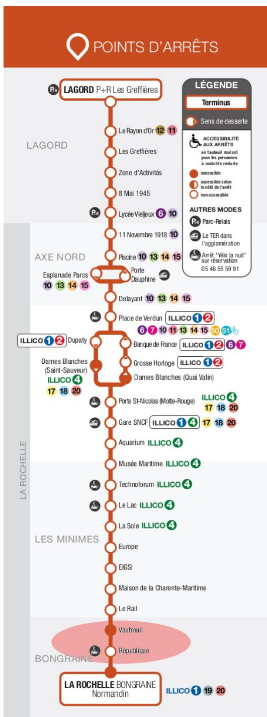
Situation des arrêts